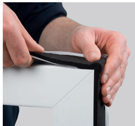
Przykład zastosowania: ISO-BLOCO ONE

Dla głębokości zabudowy powyżej 82 mm możemy zastosować ISO-BLOCO ONE „SET”. Taśma ISO-BLOCO ONE jest przy tym stosowana w sposób kombinowany z dodatkową taśmą rozszerzającą (bez wewnętrznej membrany uszczelniającej).