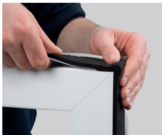
Exemple de mise en œuvre : ISO-BLOCO ONE