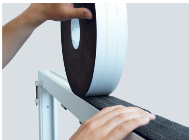
Einbaubeispiel: ISO-BLOCO HYBRATEC

ISO-TOP FLEKKLEBER XP zur Verklebung von Bandstößen